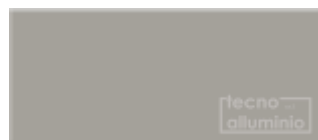
Titanio 19 BRILLANTE