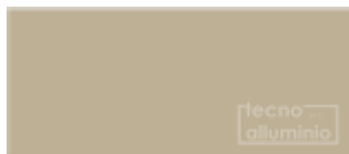
Oro 02 BRILLANTE