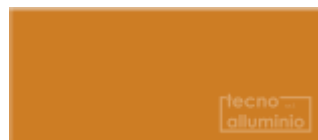
Arancio 55 BRILLANTE